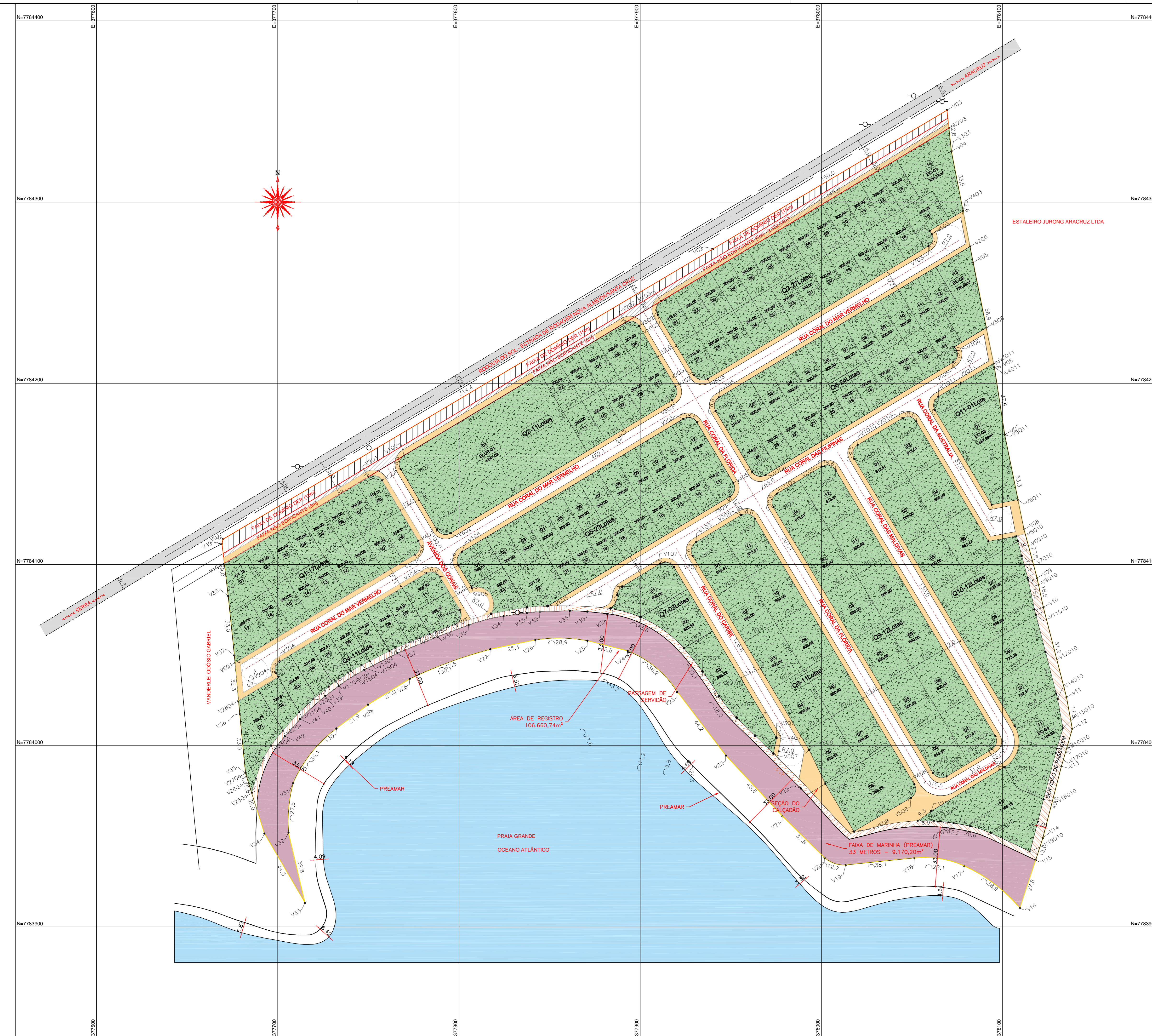
PLANTA DE SITUAÇÃO - LOTEAMENTO COSTA DOS CORAIS